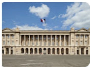
Hôtel de la Marine