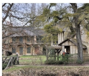
Hameau de la Reine